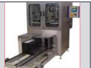
Automatische Zu-/Abführung der Paletten über Doppelgurt/Rollenförderer