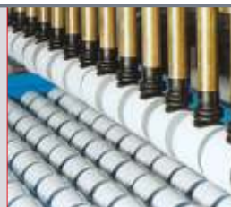
Mehrfachsauggreifsystem für eine Reinraumanwendung