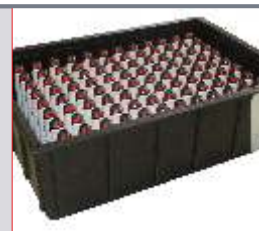
Kunststoffziehtrays für Kunststoffformteile