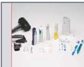
Egal ob Glaskörper, Kunststoffteile...

Durch die automatische Zuführung der Werkstückträgerpaletten erreichen Sie eine unterbrechungsfreie und sichere Produktion. Die Zuführung kann auch platzsparend über Transportwagen erfolgen.