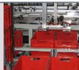
Doppelgreifsystem für KLT-Boxen Palettierung