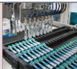
8-fach Greifsystem zur Traybeladung mit Zahnbürstenköpfen