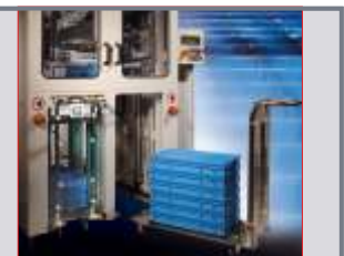
Manuelle Zu-/Abführung über Transportwagen

FLG Automation AG Max-Planck-Straße 5-7 D-61184 Karben