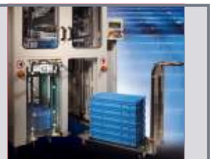
Manuelle Zu-/Abführung über Transportwagen