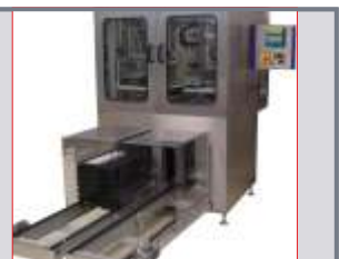
Automatische Zu-/Abführung der Paletten über Doppelgurt/Rollenförderer