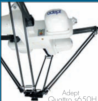
Adept Quattro s650H